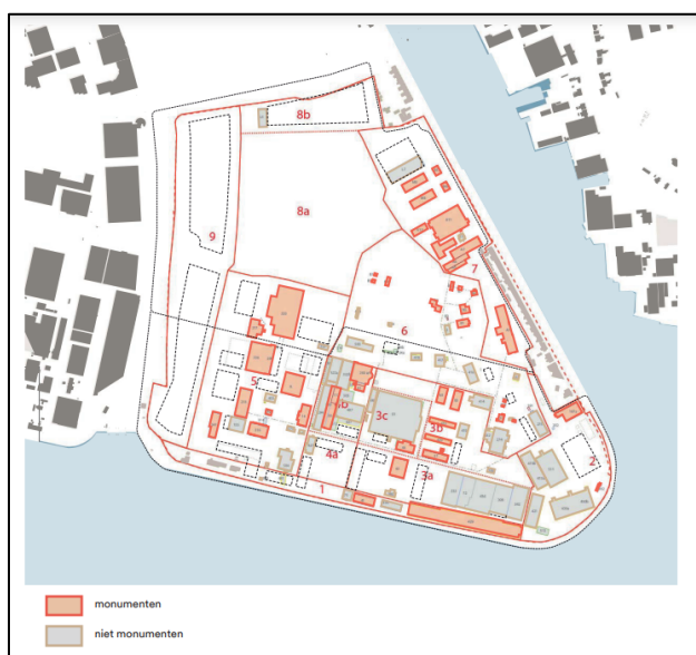
Afbeelding 1 Overzicht bestaande gebouwen Hembrugterrein

De bestaande gebouwen, met name gelegen in het zuidelijk deel van het Hembrugterrein, worden door HBZ gefaseerd overgedragen (in eigendom) aan LIFE. De eerste verkoopfase staat gepland in 2022 en bestaat voornamelijk uit monumenten (onder meer Gebouw 281-‘De Garage’, de gebouwtjes in het Plofbos, Gebouw 316 ‘Het Waslokaal’ etc.), aangevuld met een paar niet monumentale gebouwen zoals bijvoorbeeld Gebouw 430.